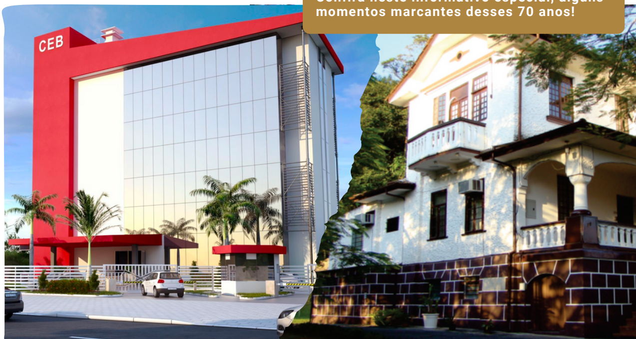
A partir de 2017

Confira neste informativo especial, alguns momentos marcantes desses 70 anos!